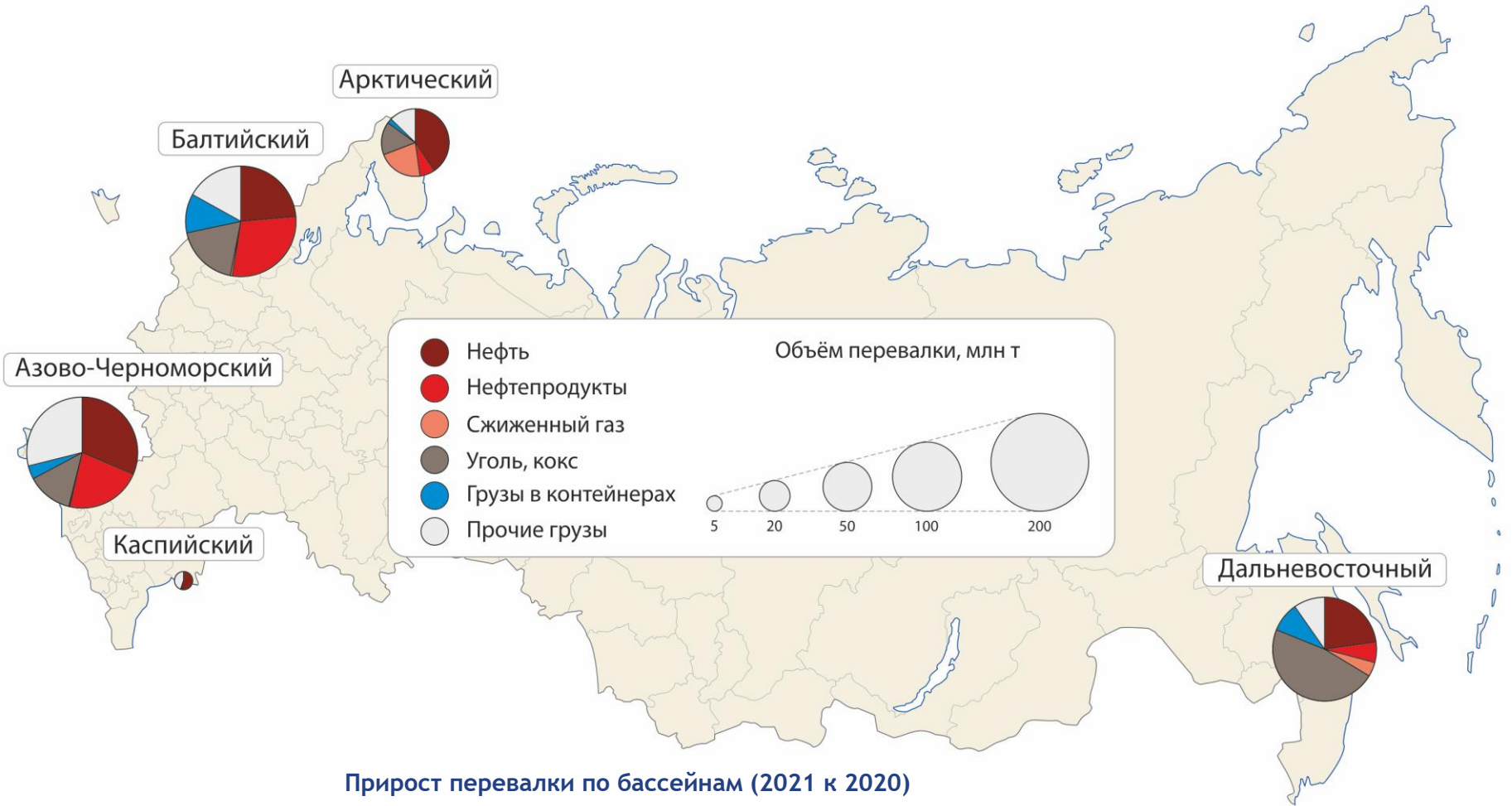
Прирост перевалки по бассейнам (2021 к 2020)