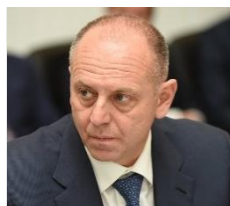
Дмитрий Пумпянский Президент Группа Синара

“ – Сейчас мы работаем над уникальным проектом для РФ по разработке и созданию собственного асинхронного привода <...> В 2021 году привод будет предоставлен для испытаний.