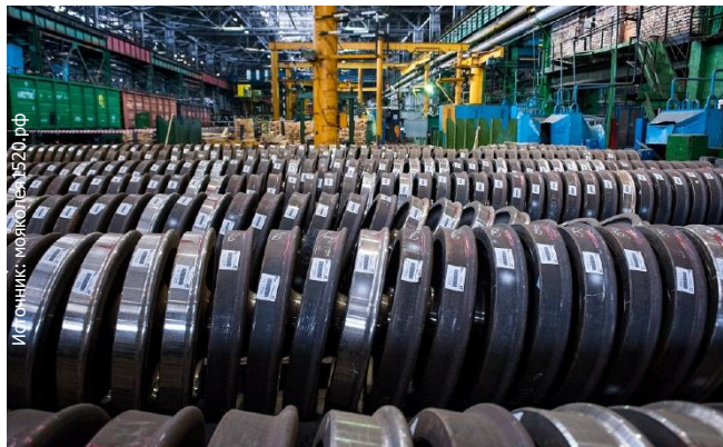
Ил. Фотик: Москва, 1520, РФ