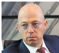
Константин Засов Президент ГК «РТК»

“ – Этот рынок (хопперов. – Прим. ред.) в 10-15 раз меньше, чем рынок полувагонов. В июне-июле мы видели, что стоит парк всех операторов зерновозов. Сегодня парка более чем достаточно для текущего объема перевозок с профицитом 10-15%. ”