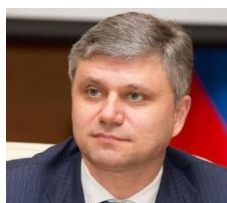
Олег Белозёров Генеральный директор ОАО «РЖД»

“ – Все нормативные элементы – уточнения в ПТЭ – мы уже внесли. Надеемся, что летом в этом году они будут приняты, чтобы законодательно мы могли закрепить возможность использования такого подвижного состава (с автоматическим управлением. – Прим. ред.) . ”